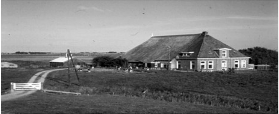
De pleats op Koehoal, fanôf de seedyk nommen, om 1960 hinne mei links de wite hikke nei ús hiem en eigen reed ta. Sjoch ek in tillefoanpeal, kealtsjes, it poaterhok (stiet der noch) en doe hielendal gjin loadsen achter de skuorre...